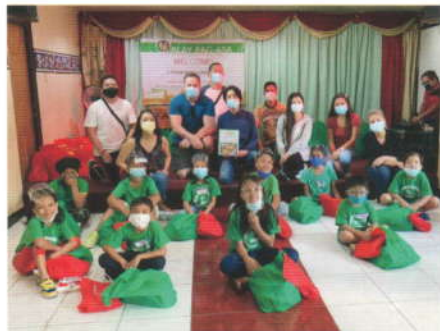
2020年実施(コロナ対策の為、規模を縮小して行いました)