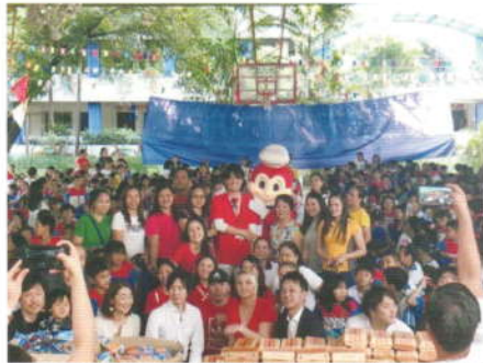
2019年実施(多くの子供達を集めて、大規模に行いました)